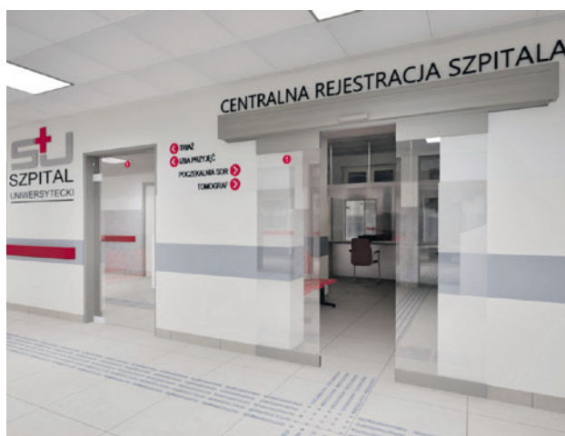
Wizualizacja. Tam gdzie jeszcze dziś znajduje się szpitalny bar, powstanie centralna rejestracja szpitalna.

Przebudowa oddziału ratunkowego, która obejmie też przyległe do niego pomieszczenia, będzie przebiegać odciwkami, a np. segment socjalny i gospodarczy tymczasowo lokum znajdują w pomieszczeniach po urologii, która zostanie przeniesiona w miejsce dwa lata temu opuszczo-