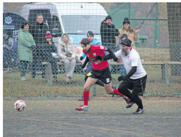
Mecz Niepodległości zawsze ma wymiar charytatywny