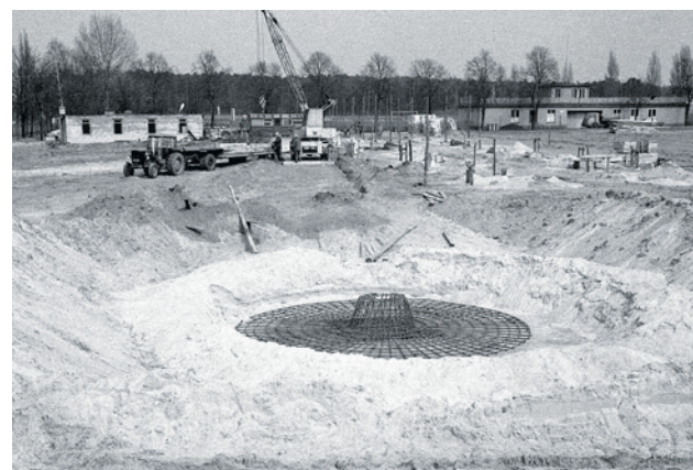
Fundamenty pod budowę słupów z tarczami