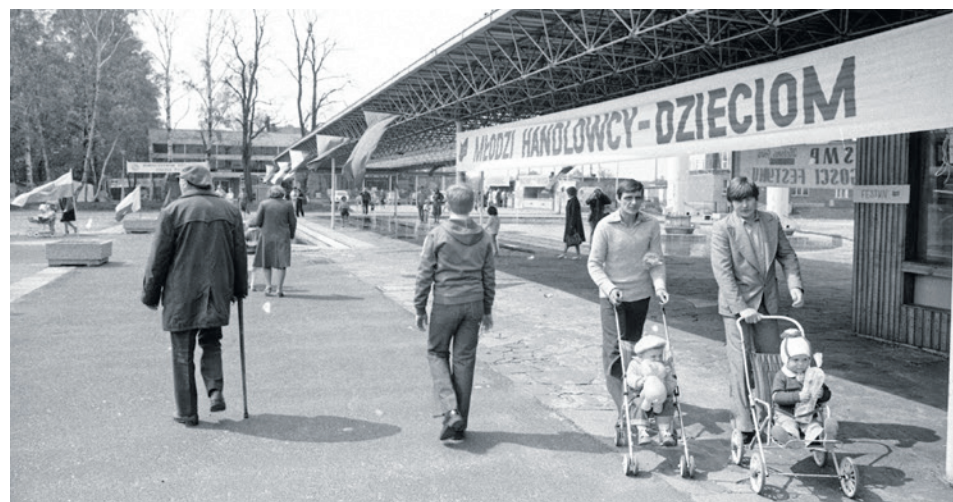
Przy Sulechowskiej organizowano wiele imprez - tutaj Dzień Dziecka