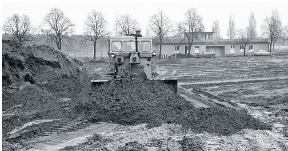
Przygotowanie placu pod budowę ośrodka. W tle stadion.