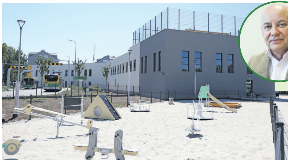
Nowa szkoła, z osobnymi wejściami do części szkolnej i przedszkolnej, znajduje się przy ul. Architektów