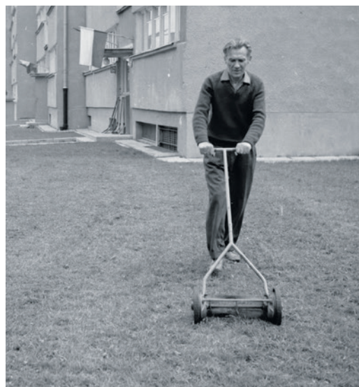
Ul. Janka Krasickiego, pozostała jeszcze pielęgnacja trawy