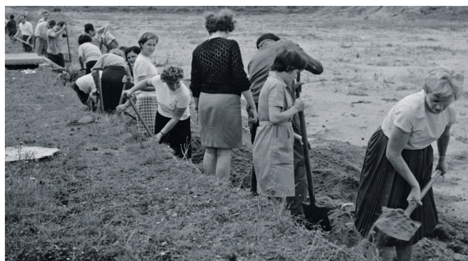
Czyn społeczny - budowa kortów tenisowych przy ul. Wyspiańskiego