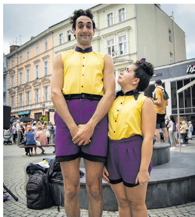
Artyści uliczni zabrają nas w magiczną podróż

Za sprawą ulicznych artystów, z których większość przyjedzie do nas po raz pierwszy, 27 i 28 sierpnia w godz. 12.00-22.00 serce miasta ożyje kolorami, autorską muzyką, tańcem, teatrem i sztuką cyrkową. Performerzy z kilkunastu krajów - Tajwanu, Nowej Zelandii, Japonii, Kanady, Chile, Egiptu, Australii, Bułgarii, Austrii, Meksyku, Argentyny i Polski - zabrają nas w magiczną podróż, prezentując znane i nieoczywiste numery i gagi. Strzelanie z łuku, klaunada,