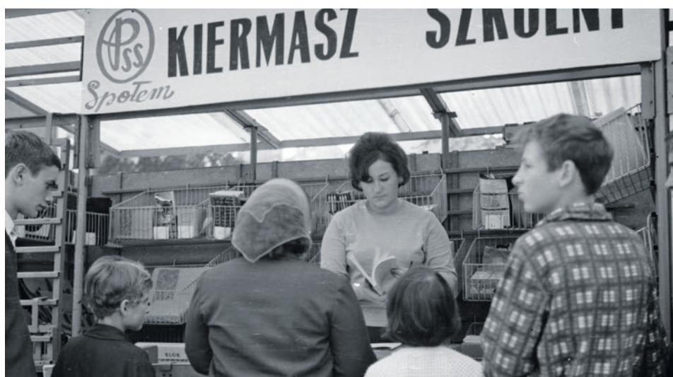
Kiermasz szkolny na pl. Powstańców Wielkopolskich