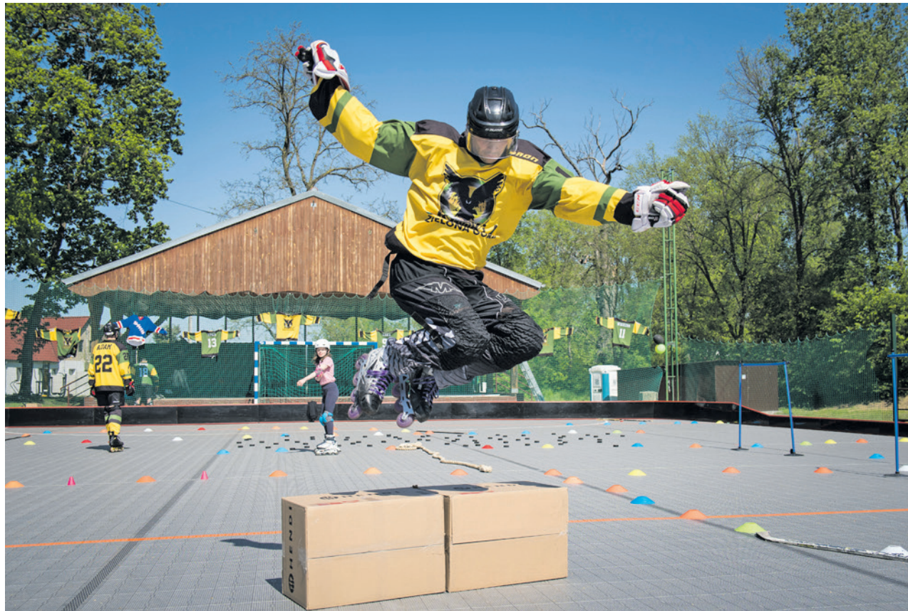
Za sprawą Budżetu Obywatelskiego rolkarze śmigają w Przylepie