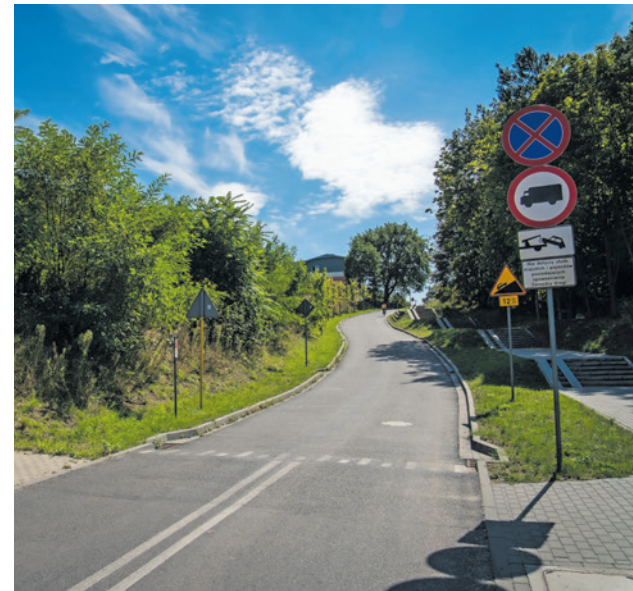
Budżet Obywatelski spełnił marzenia mieszkańców o połączeniu ul. Ludowej ze Źródłaną

W BO 2025 miasto dopuszcza możliwość zgłaszania remontów dróg lokalnych i osiedlowych, ale pod warunkiem, że w magistracie są gotowe plany i dokumentacja do wykorzystania. - Szkoda, żeby się marnowały. Pamiętajmy, że takie plany też ulegają przedawnieniu. Warto wykorzystać ten katalog dróg, bo problem remontów mniejszych ulic był przez lata w Zielonej Górze ignorowany. Teraz mamy szansę to zmienić - mówi radny Dariusz Legutowski. Dlaczego nie każda droga może zostać poddana pod głosowanie? - Założenia BO jasno wskazują, że zadanie musi być w pełni zrealizowane w ciągu roku. Z naszego doświadczenia wynika, że czas inwestycji drogowej, przygotowanie projektu wraz z opiniami zajmuje średnio rok. Realizacja inwestycji przekroczyłaby terminy - wyjaśnia radna Agnieszka Chyrc. - Takich prac nie można też etapować z powodu niewiadomej, czy ten drugi etap zostanie wybrany przez mieszkańców w kolejnym głosowaniu.