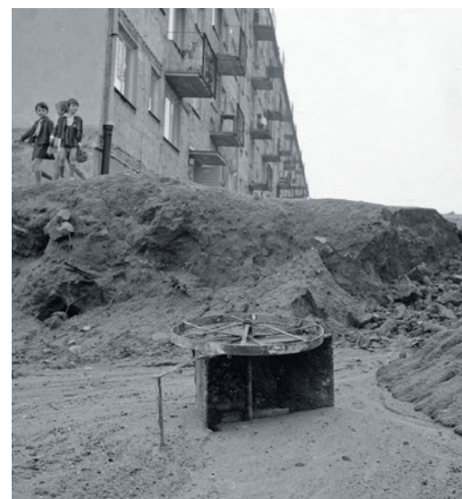
Na budowie - zostało jeszcze trochę do uporządkowania