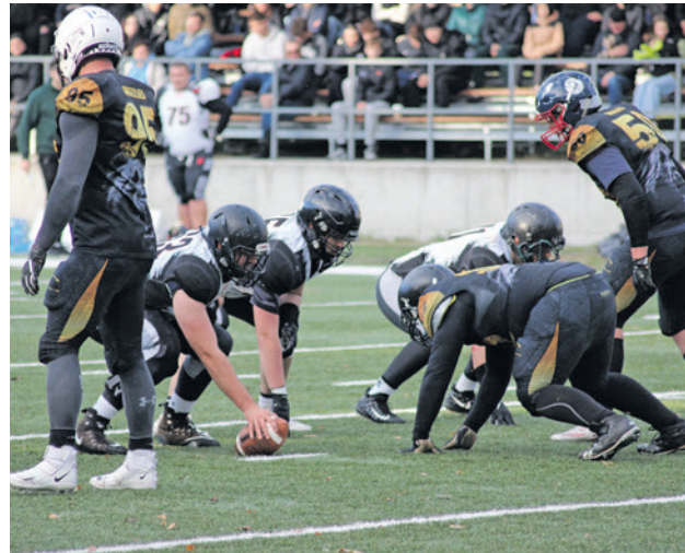
Przed rokiem na Watahę nie było mocnych! Jak będzie teraz?

- Ubiegłoroczny sukces przełożył się też na zainteresowanie. Świetnie potoczyła się nasza rekrutacja, campy