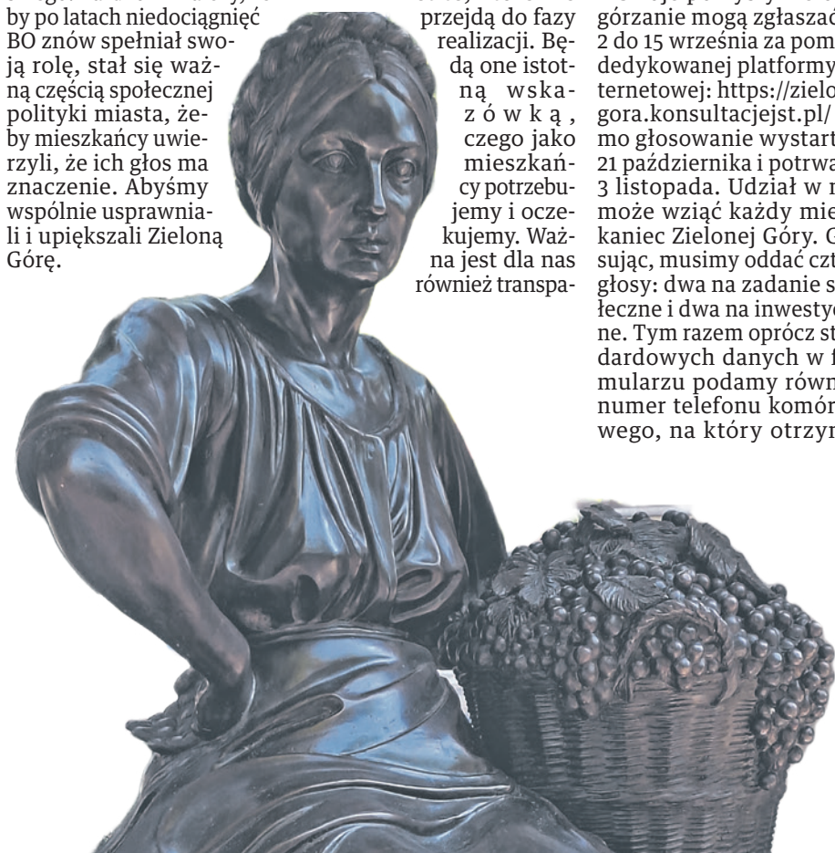
Winiarka Emma „powróciła” do nas dzięki Budżetowi Obywatelskiemu

Podczas konferencji prasowej poświęconej Budżetowi Obywatelskiemu 2025 prezydent Marcin Pabierowski zaprezentował wózek konsultacyjny, który ułatwi kontakty z mieszkańcami. - Takich gadżetów wspierających całą inicjatywę będzie więcej. Realizacja BO ma wymiar edukacyjny, ale to także zabawa. Ten format wciągania zielonogórczyków do udziału będzie przede wszystkim rozwijany. Stawiamy na innowacyjne podejście - zapowiada M. Pabierowski. Miasto zamierza także wyjść naprzeciw osobom wykluczonym cyfrowo. - Przez cały okres głosowania zostaną wyznaczone specjalne stacjonarne punkty. Będą z nich mogli korzystać mieszkańcy, którzy z jakiegokolwiek powodu nie chcą lub nie mogą głosować elektronicznie - wyjaśnia radna Chyrc.