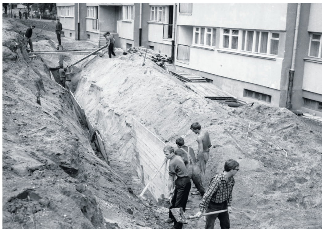
Pracownicy Lasów Państwowych pracują przy swoim domu

W latach 60. XX wieku czyny społeczne były nagminnie stosowaną metodą wspierania miejskich inwestycji. Często były organizowane przez zakłady pra-